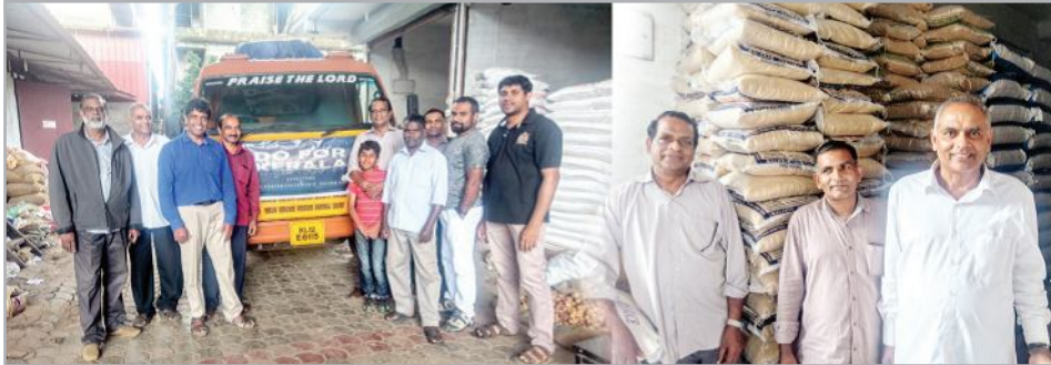
പ്രത്യയബാധിതർക്ക് ഒരു കൈത്താങ്ങായി ബത്തേരി പി.പി.എഫ്. (പ്രവർത്തിച്ചിട്ടുള്ള)