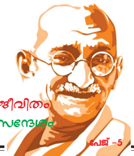
പേജ് - 5