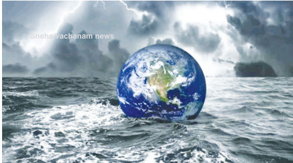
Sneha vachanam news

സെപ്റ്റംബർ 23ന് ലോകം അവസാനിക്കും എന്നായിരുന്നു സമൂഹമായ യൂമങ്ങിൽ