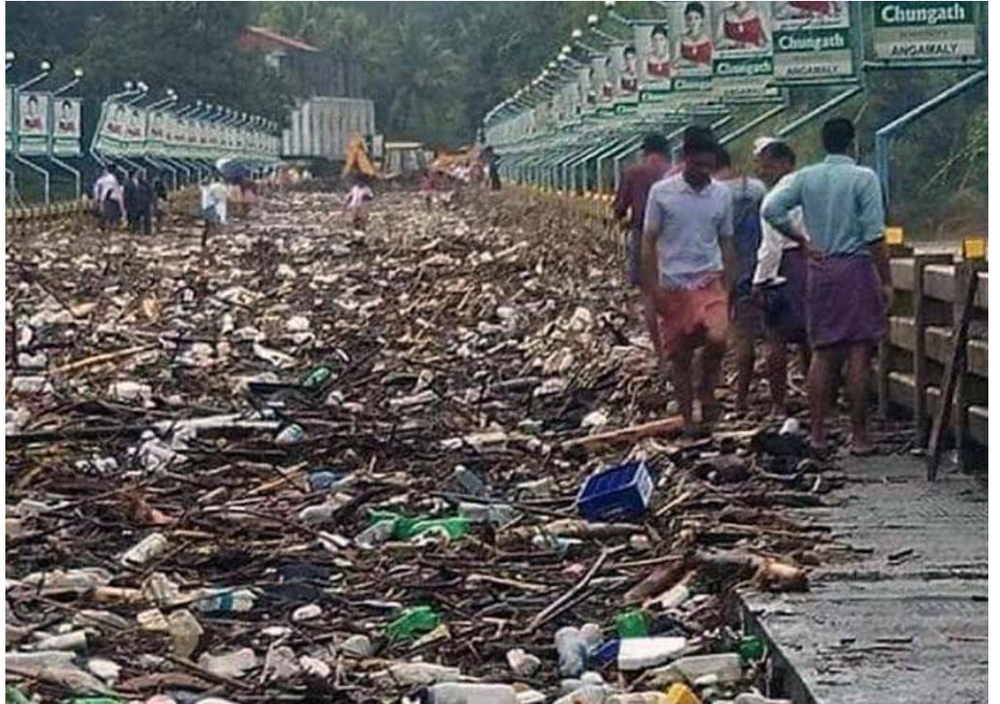
പ്രളയനന്തരം: വെള്ളം ഇറങ്ങിയപ്പോൾ മലയാറ്റൂർ പാലത്തിൽ കുമിഞ്ഞുകൂടിയ മാലിന്യങ്ങൾ.

മാധൻ ജൂലിയൻ ഓസിലേഷൻ എന്ന പ്രതിഭാസമെന്നു വിദഗ്ദ്ധരുടെ അഭിപ്രായം. കടൽവെള്ളത്തിന്റെ ചുട്ടുകുടുന്നതും സഹ്യപർവതം അതിനെ തടയുന്നതുമാണ് അമിതമഴയ്ക്കു കാരണം. ന്യൂനമർദ്ദം കൂടുന്നതിനു കാരണം കടലിലെ താപനില വർധിക്കുന്നതുകൊണ്ടാണ്. കടലിലെ താപനില നിയന്ത്രിക്കാൻ പ്രകൃതിതന്നെ സ്വയം കണ്ടെത്തുന്ന പ്രതിഭാസമാണ് ന്യൂനമർദ്ദവും തുടർന്നുണ്ടാകുന്ന മഴയും. പശ്ചിമഘട്ടസാന്നിധ്യം കൂടുതൽ മഴപെയ്യിക്കുന്നു. പ്രകൃതിദുരന്തമേതിലും തുണ സർവശക്തനായ ദൈവം മാത്രം. കർത്താവ് അറിയാതെ ഒന്നും സംഭവിക്കുന്നില്ല. "ദൈവം നമ്മുടെ സങ്കേതവും ബലവുമാകുന്നു." കഷ്ടങ്ങളിൽ പതറിപ്പോകാതെ, ദുഃഖത്തിലും വേദനയിലും നഷ്ടങ്ങളിലുമിരിക്കുന്നവരുടെ കണ്ണിരൊപ്പുകയും ഒരുക്കെ സഹായത്തിന് ഒരുമിക്കുകയും ചെയ്യാം.