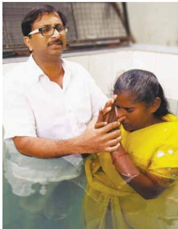
ബാപ്റ്റിസ്റ്റ്: ചർച്ച് ഓഫ് ഗോഡ് ഹോര്മാവ് സഭയിൽ നടന്ന സന്നാനശ്ശശ്രേഷ്ഠ് പാസ്റ്റർ വിജീഷ്കുമാർ നേതൃത്വം കൊടുക്കുന്നു.