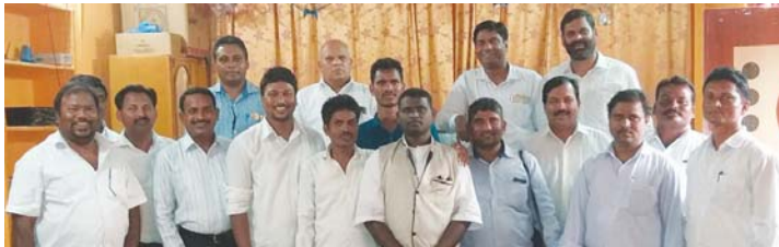
ചർച്ച് ഓഫ് ഗോഡിനോട് കർണാടകയിൽ പുതിയതായി ചേരാൻ താല്പര്യപ്പെട്ട ശുശ്രൂഷകന്മാർ ഓവർസിയറോടൊപ്പം