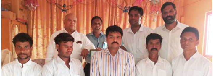
സന്നാഹപ്പെട്ടവർ സ്റ്റേറ്റ് ഓവർസിയറോടും ടീമിനോടും ഒപ്പം