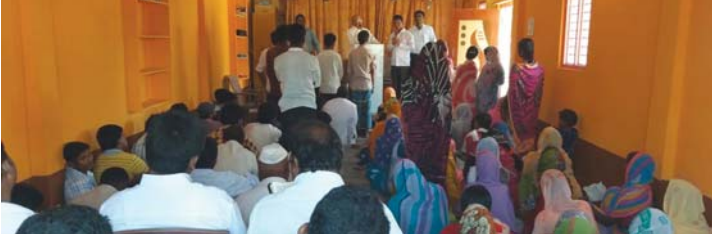
സിദ്ധാപുര സഭാഹാളിൽ സ്റ്റേറ്റ് ഓവർസിയർ പ്രസംഗിക്കുന്നു. സന്നാഹപ്പെടുവാൻ തീരുമാനമെടുത്തവർ പ്രാർത്ഥനയ്ക്കായി മുന്നോട്ടു വന്നു നില്ക്കുന്നു. ഈ സഭാഹാളാണ് ദൈവസഭയ്ക്ക് എഴുതിത്തരുവാൻ ആഗ്രഹിക്കുന്നത്.