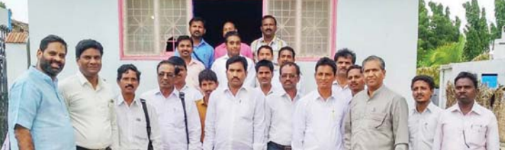
സുവാർത്താ പ്രയാണയിൽ ചർച്ച് ഓഫ് ഗോഡിനോട് ചേരാൻ താല്പര്യപ്പെട്ട ശുശ്രൂഷകന്മാർ